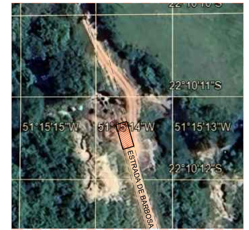
PLANTA DE SITUAÇÃO SEM ESCALA Coordenadas: 22°10'10,74\"/>