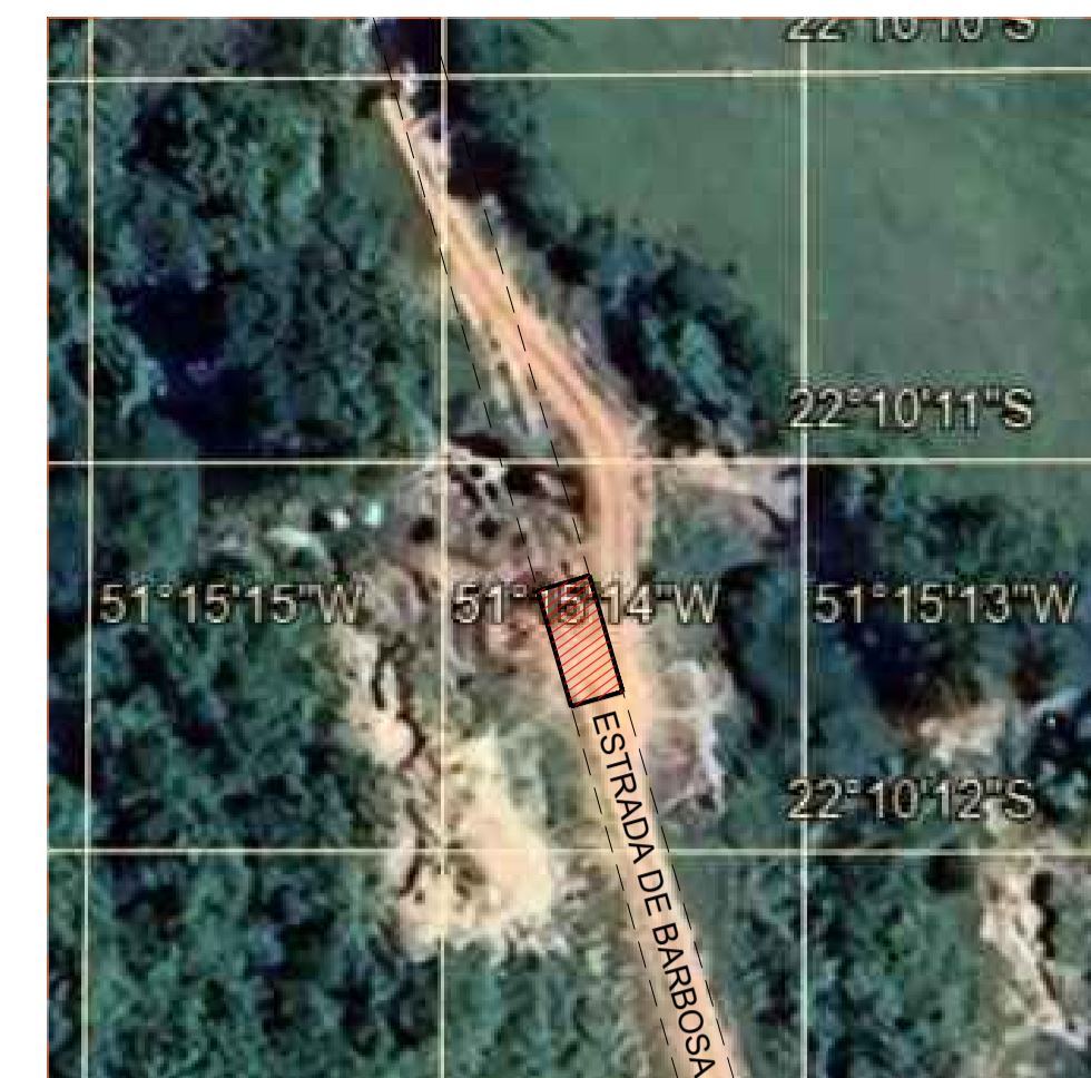
PLANTA DE SITUAÇÃO SEM ESCALA Coordenadas: 22°10'10,74" S / 51°15'14,23" W